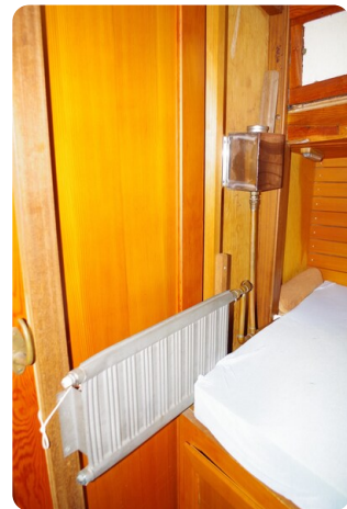
Bültjer Kutter msp625720 20