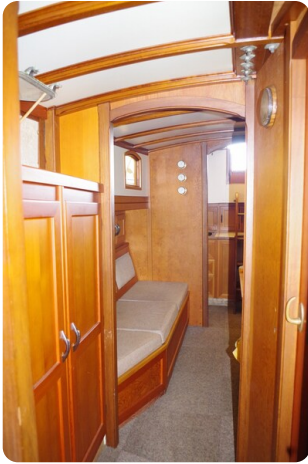
Bültjer Kutter msp625720 17