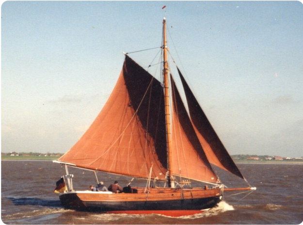
Bältjer Kutter msp625720 1