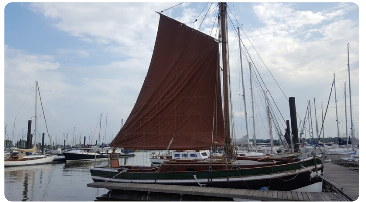
Bild1Bältjer Kutter msp625720 2