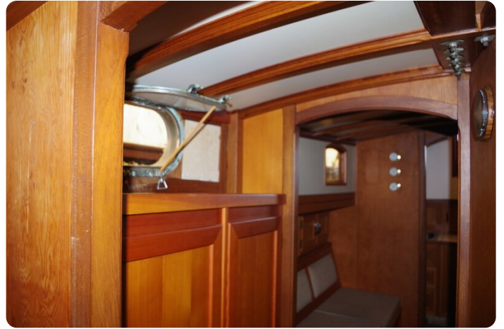
Bültjer Kutter msp625720 18