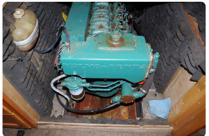
Bültjer Kutter msp625720 22