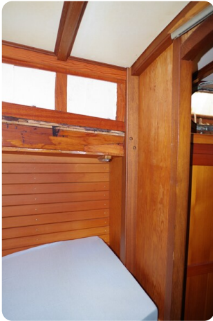
Bültjer Kutter msp625720 19