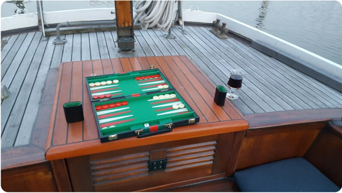
Bültjer Kutter msp625720 23