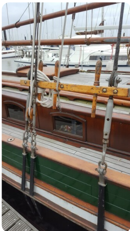
Bild3Bältjer Kutter msp625720 3