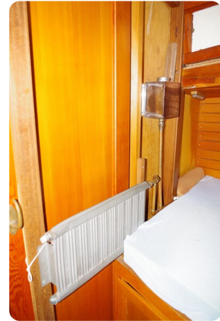
Bültjer Kutter msp625720 20