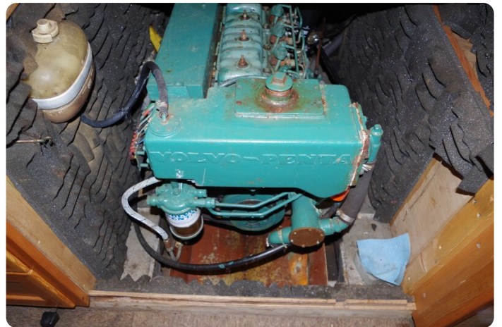
Bültjer Kutter msp625720 22