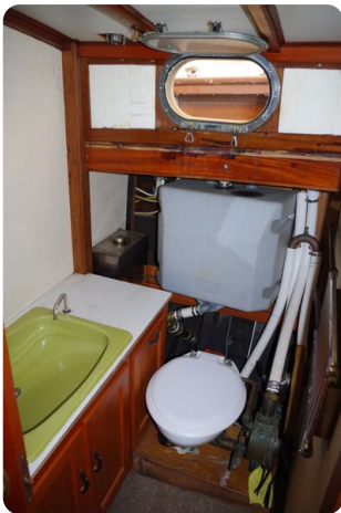
Bültjer Kutter msp625720 21