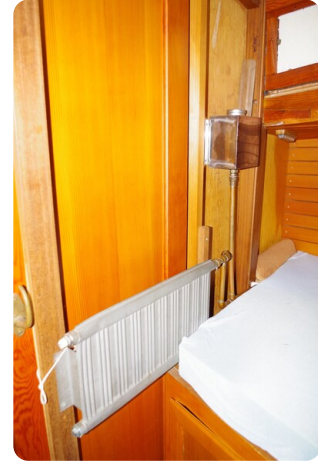
Bültjer Kutter msp625720 20