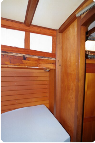
Bültjer Kutter msp625720 19