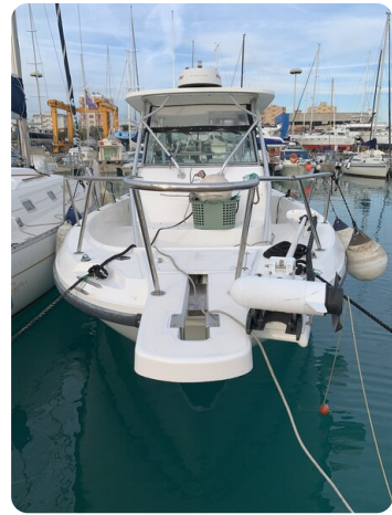
Boston 28 Outrage bow view