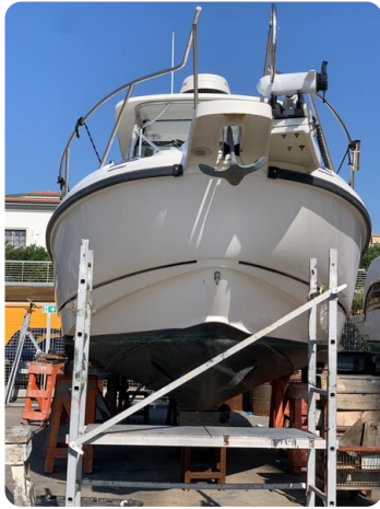
Boston 28 Outrage hull view