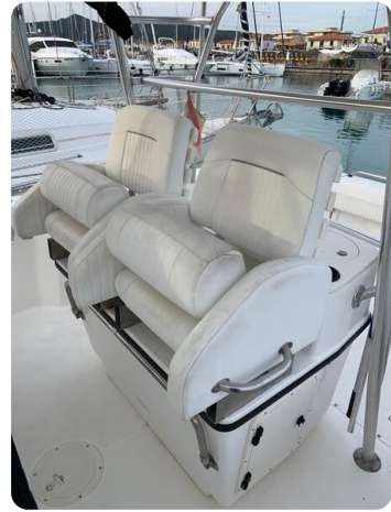
Boston 28 Outrage helm seats