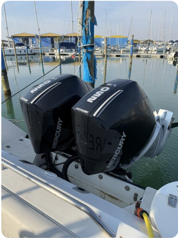
Boston 28 Outrage new engines