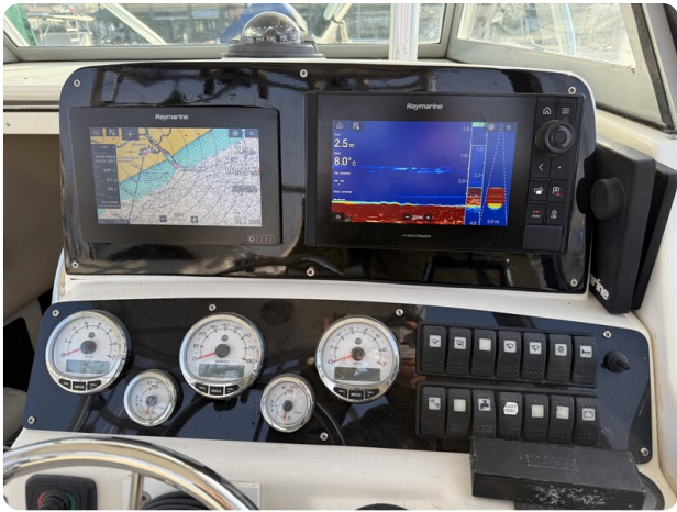
Boston 28 Outrage helm detail