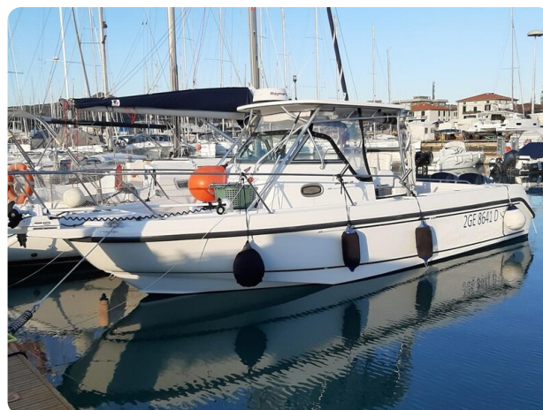
Boston 28 Outrage profile