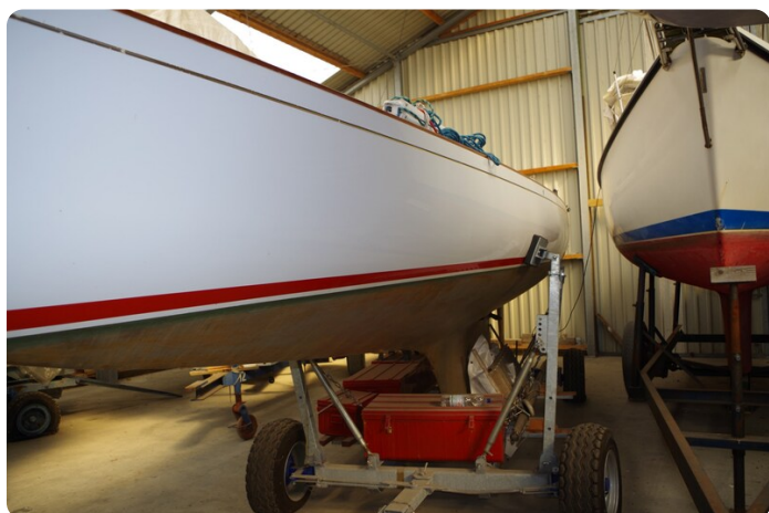
Schärenkreuzer FLORIAN 12