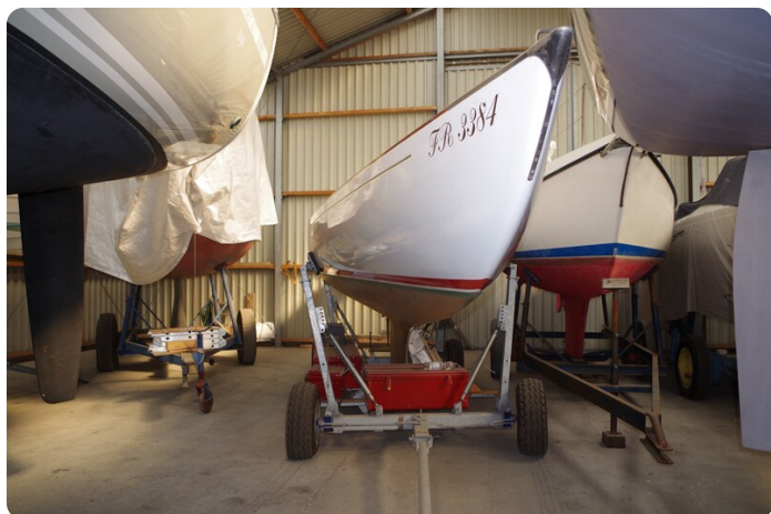
Schärenkreuzer FLORIAN 10