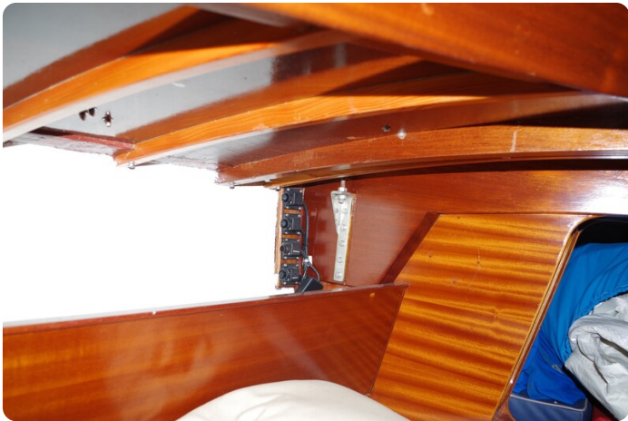
Schärenkreuzer FLORIAN 50