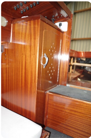
Schärenkreuzer FLORIAN 54