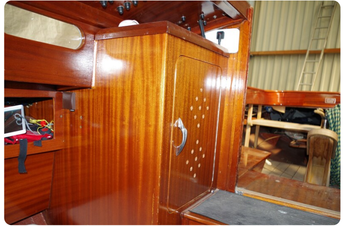
Schärenkreuzer FLORIAN 53