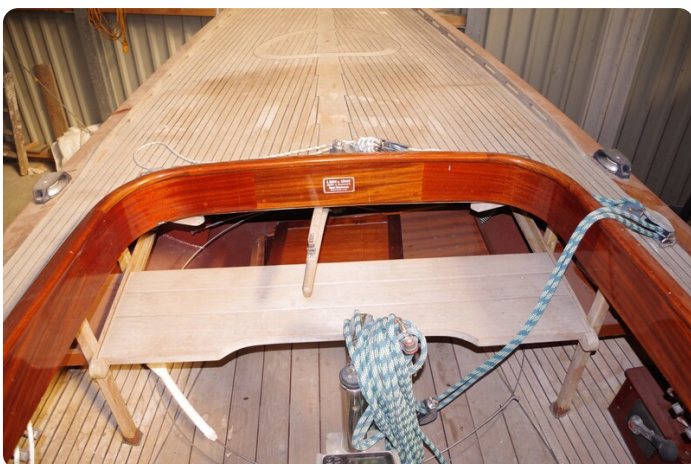
Schärenkreuzer FLORIAN 29