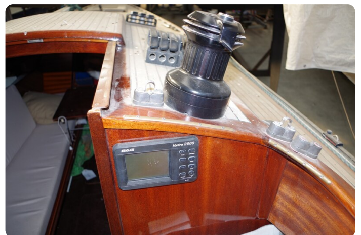
Schärenkreuzer FLORIAN 35