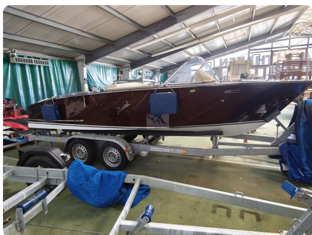
Boesch 590 Cabrio Deluxe CARPE DIEM 35