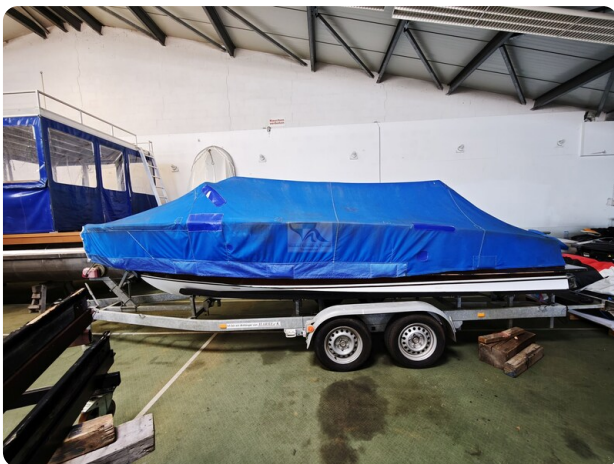
Boesch 590 Cabrio Deluxe CARPE DIEM 11