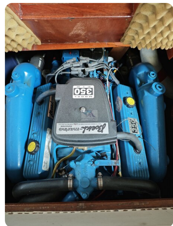
Boesch 590 Cabrio Deluxe CARPE DIEM 25