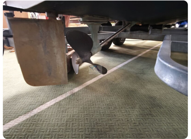
Boesch 590 Cabrio Deluxe CARPE DIEM 37