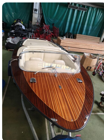
Boesch 590 Cabrio Deluxe CARPE DIEM 34