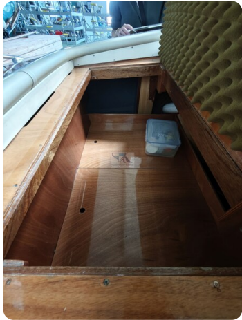
Boesch 590 Cabrio Deluxe CARPE DIEM 39