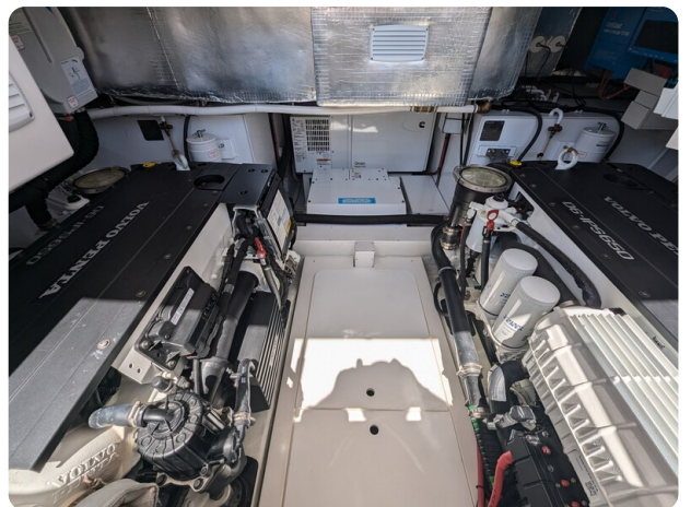
{1} Engine room