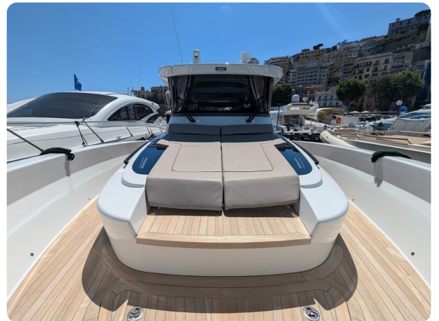
Bow deck sunpad