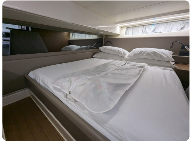
{1} Aft cabin