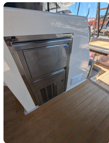
Bluegame 42 cockpit ice maker