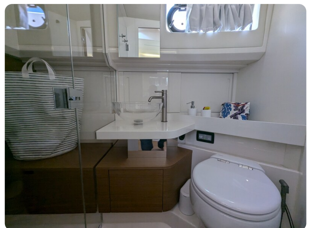
Bluegame 42 bathroom