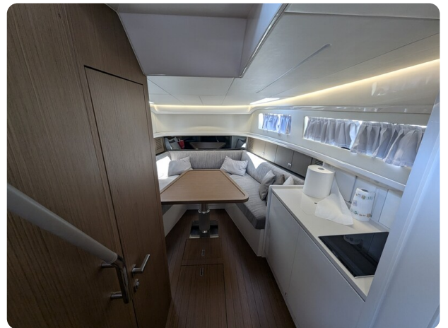
Bluegame 42 interiors