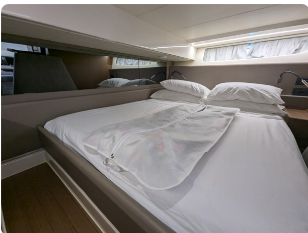
Bluegame 42 aft cabin