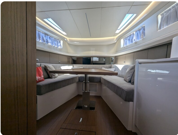
Bluegame 42 conv. dinette