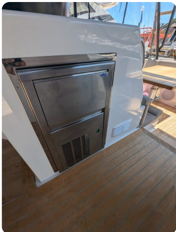
Bluegame 42 cockpit ice maker