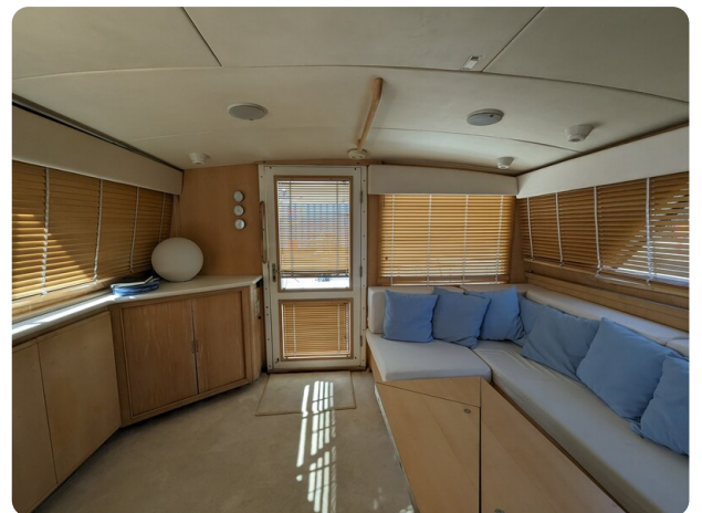
Bertram 43 Conv. salon