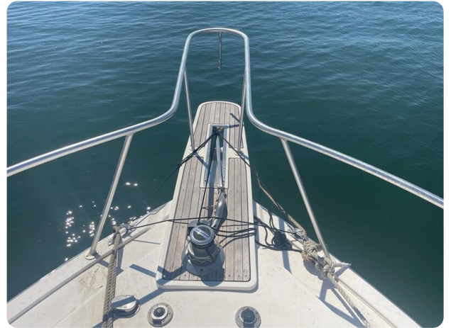
Bertram 43 convertible