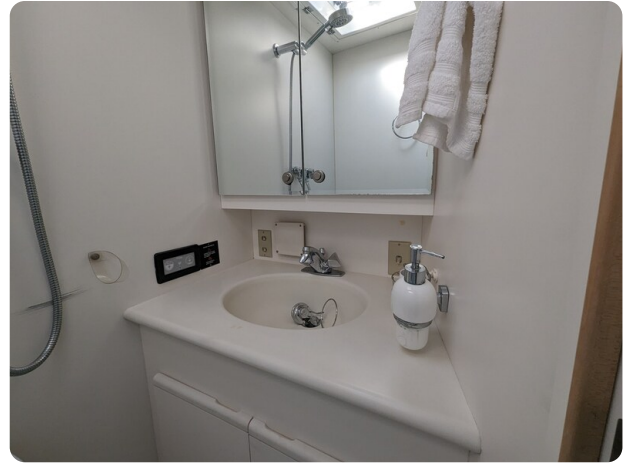
Bertram 43 Conv. guest bathroom