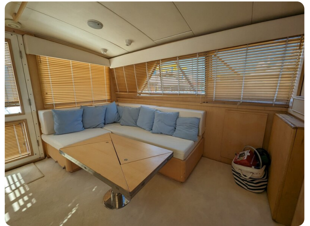
Bertram 43 Conv. dinette