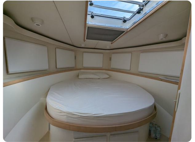
Bertram 43 Conv. master cabin