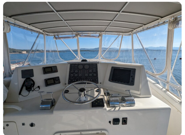
Bertram 43 Conv. Helm station