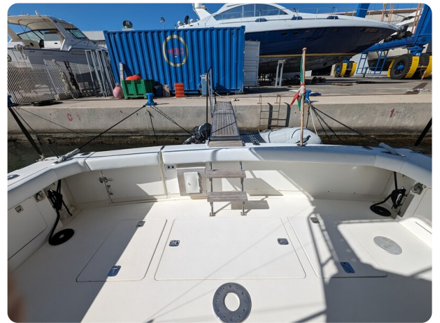
Bertram 43 Conv. cockpit