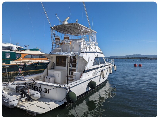
Bertram 43 Conv. aft profile