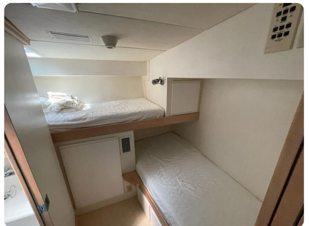
Bertram 43 Conv. Guest cabin