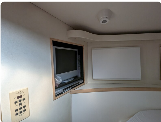
Bertram 43 Conv. master cabin Tv