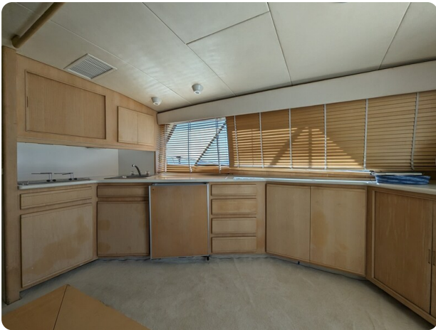
Bertram 43 Conv. salon detail