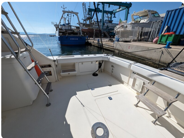
Bertram 43 Conv. cockpit view