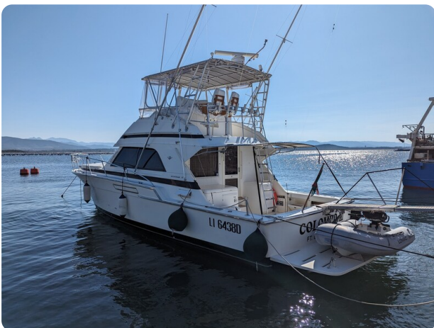
Bertram 43 Conv. profile