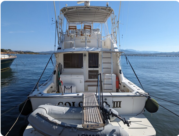
Bertram 43 Conv. aft view