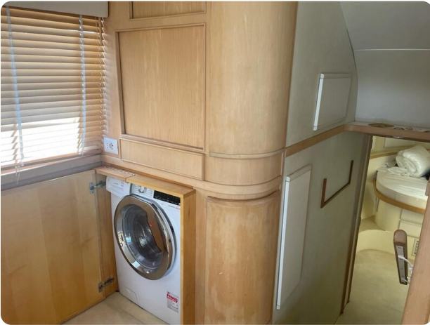
Bertram 43 Conv. details