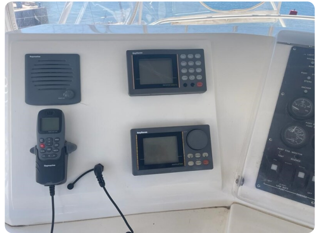
Bertram 43 vhf