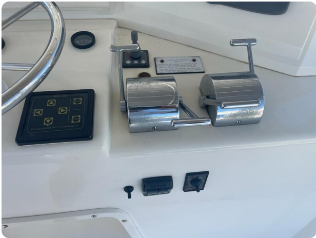
Bertram 43 Conv. throttles