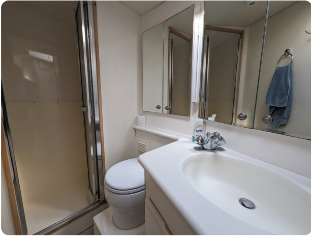
Bertram 43 Conv. master bathroom