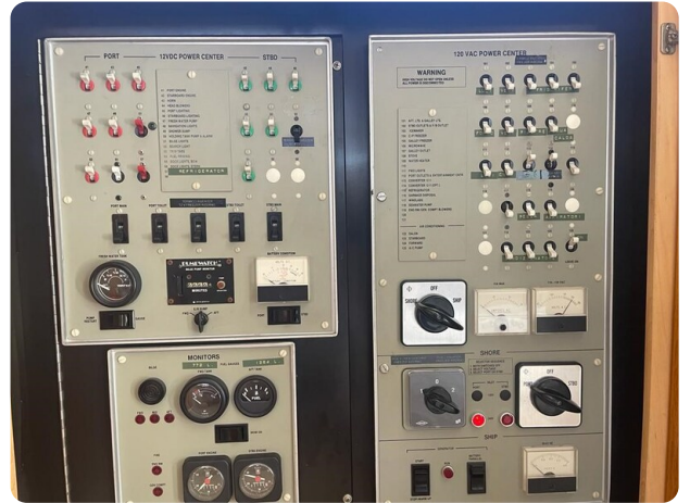
Bertram 43 convertible