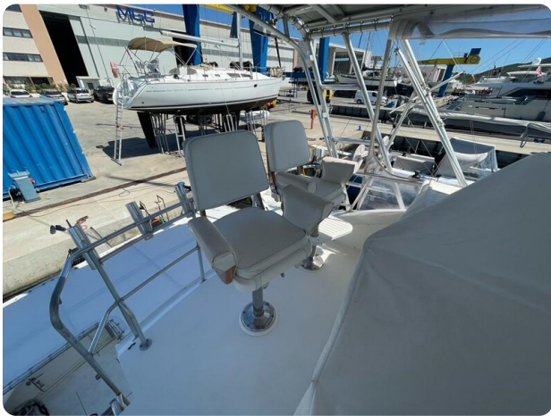
Bertram 43 fly helm