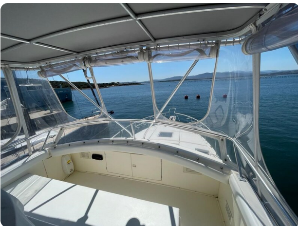
Bertram 43 conv fly 1