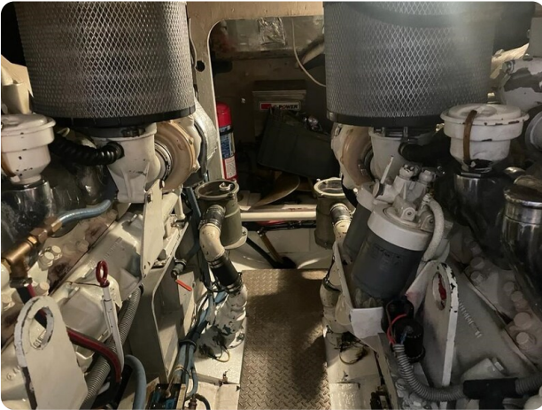
Bertram 43 Conv. engine room