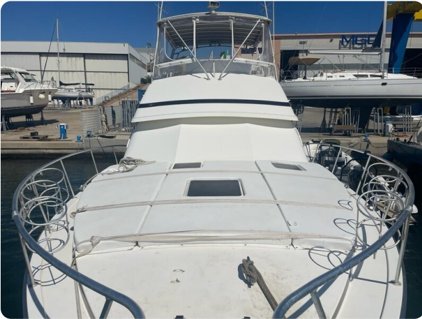
Bertram 43 Conv. fwd deck