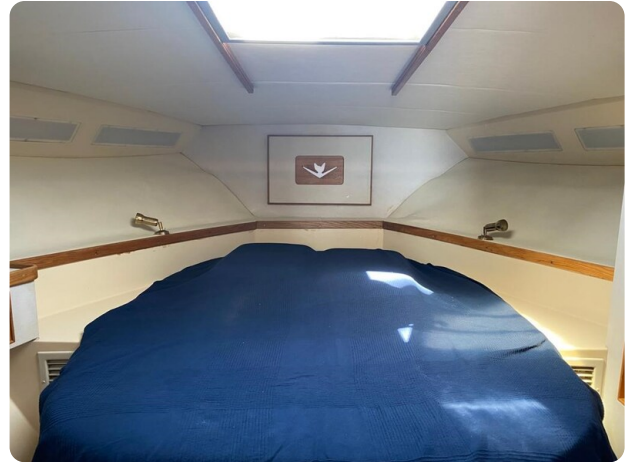
Bertram 37, cabin