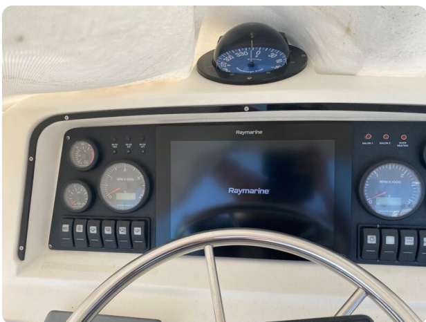
Bertram 37, electronics