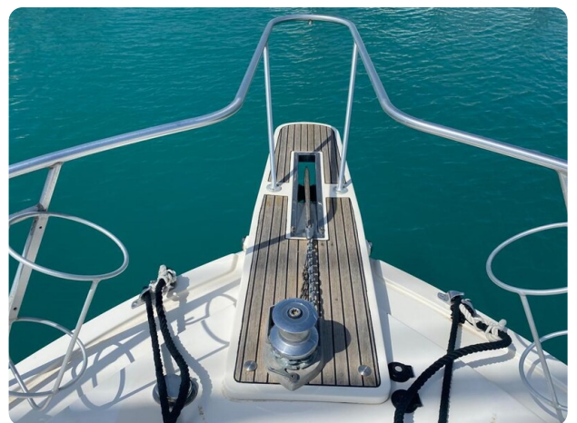
Bertram 37, bow pulpit