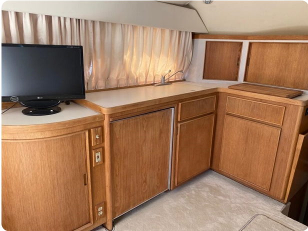
Bertram 37, galley view