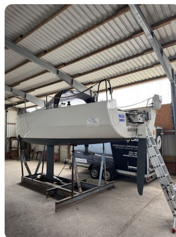
Bente 24 MUGGEL 3