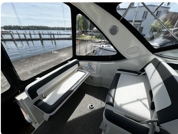
Bayliner 285 - MSP 39