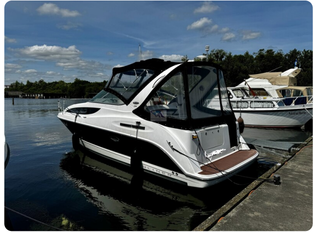
Bayliner 285 - MSP 71 ersetzen