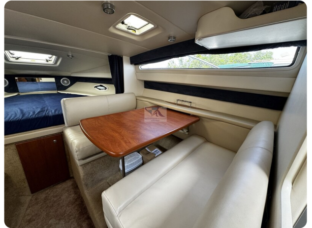
Bayliner 285 - MSP 5