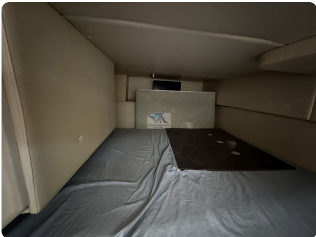
Bayliner 285 - MSP 20