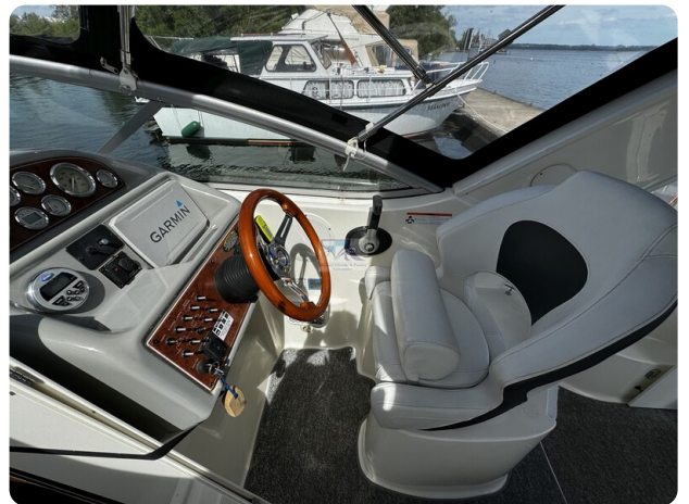
Bayliner 285 - MSP 34