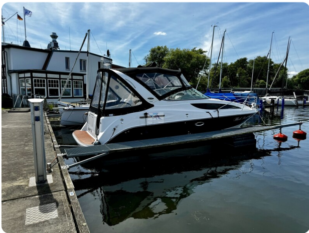
Bayliner 285 - MSP 72