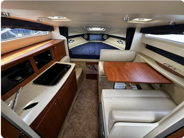
Bayliner 285 - MSP 11