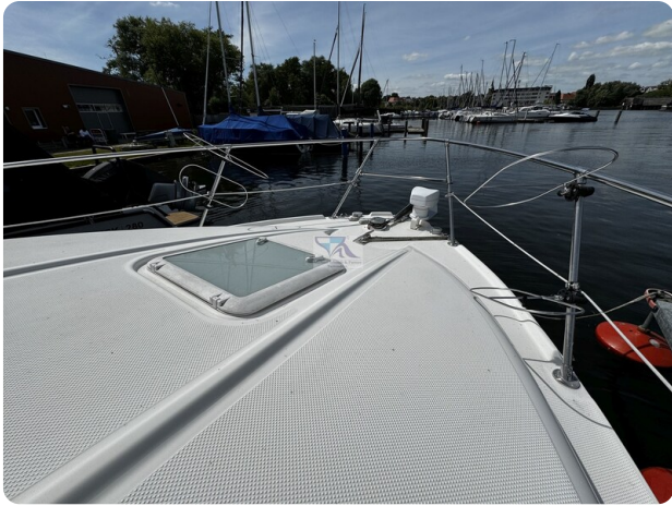
Bayliner 285 - MSP 46