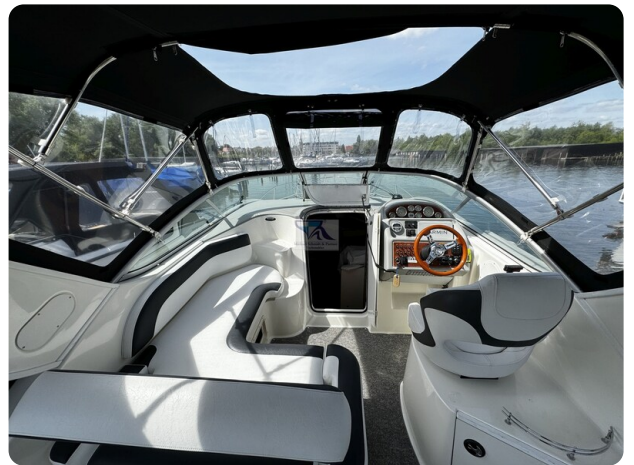
Bayliner 285 - MSP 31