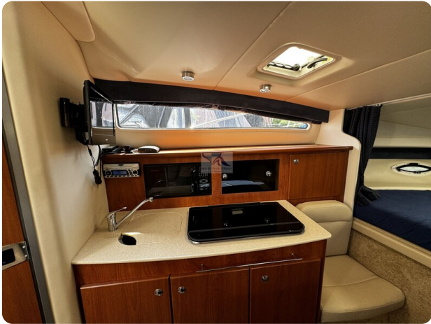
Bayliner 285 - MSP 8