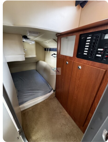
Bayliner 285 - MSP 18