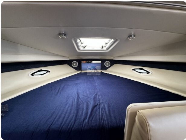
Bayliner 285 - MSP 3