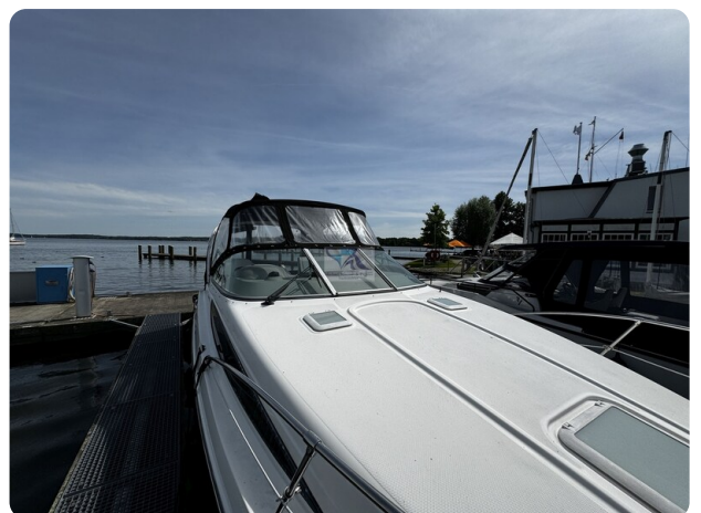
Bayliner 285 - MSP 45