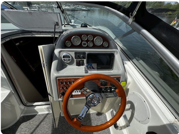
Bayliner 285 - MSP 33