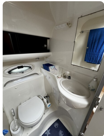
Bayliner 285 - MSP 25