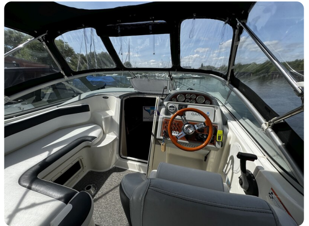
Bayliner 285 - MSP 27