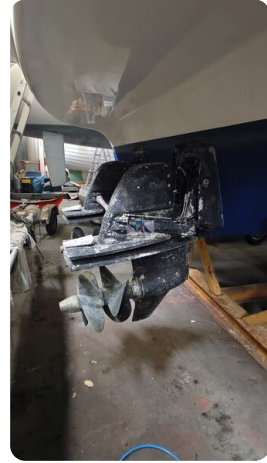
Bavaria 37 Sport msp793423 2