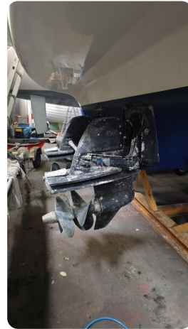
Bavaria 37 Sport msp793423 2