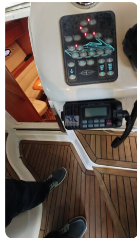
Bavaria 37 Sport msp793423 31