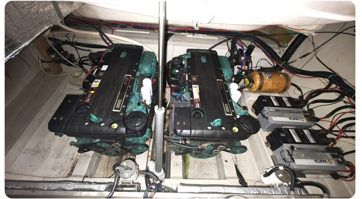
Bavaria 37 Sport msp793423 36