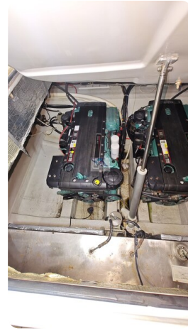
Bavaria 37 Sport msp793423 41