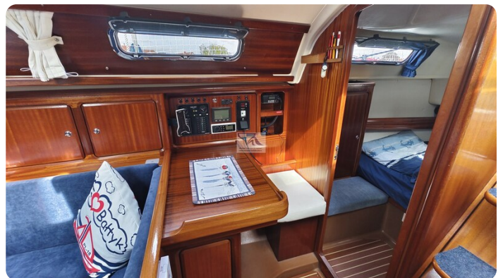
Bavaria 37_msp 15