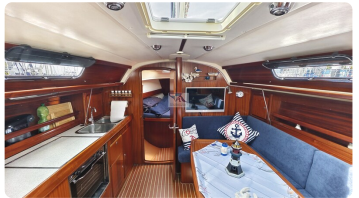
Bavaria 37_msp 20