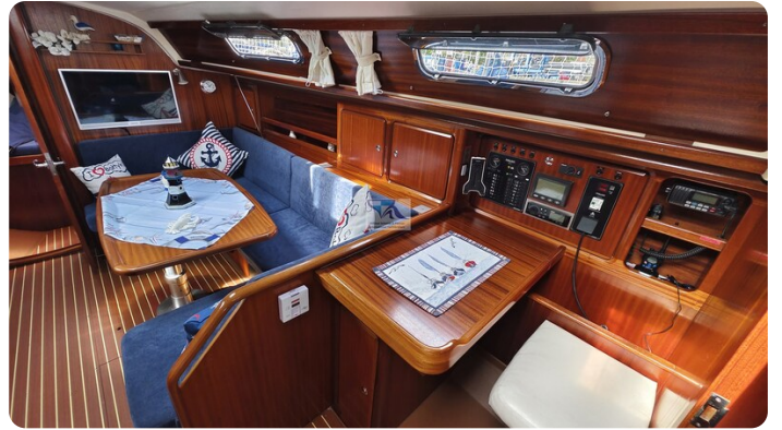
Bavaria 37_msp 12