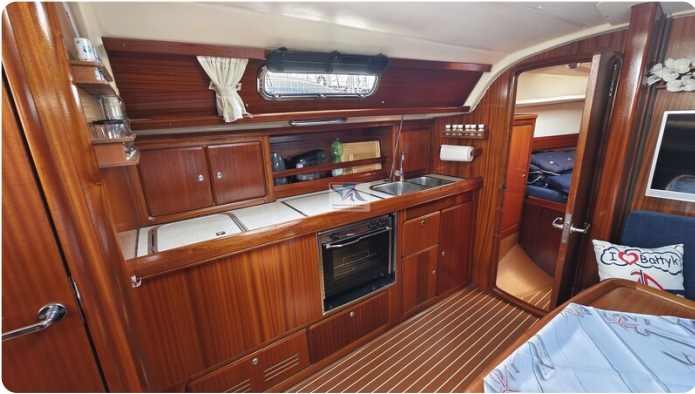
Bavaria 37_msp 14