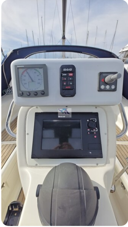
Bavaria 37_msp 66