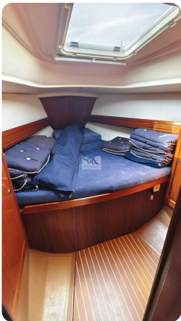
Bavaria 37_msp 21