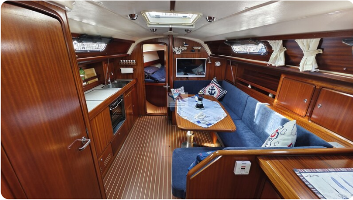
Bavaria 37_msp 11