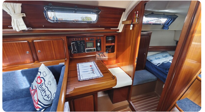
Bavaria 37_msp 15