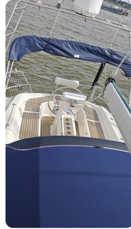
Bavaria 37_msp 57