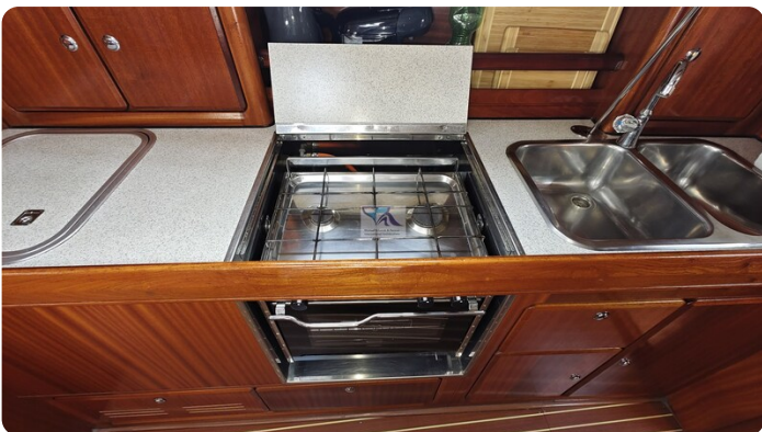
Bavaria 37_msp 31