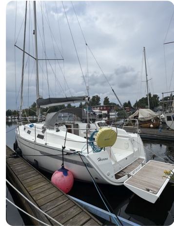
Bavaria 32 Cruiser HERON 2