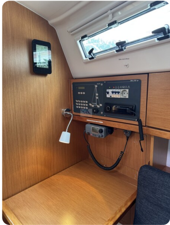
Bavaria 32 Cruiser HERON 35