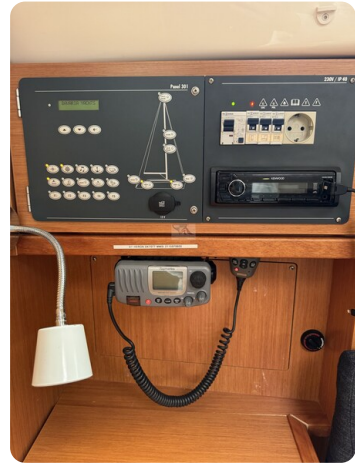
Bavaria 32 Cruiser HERON 36