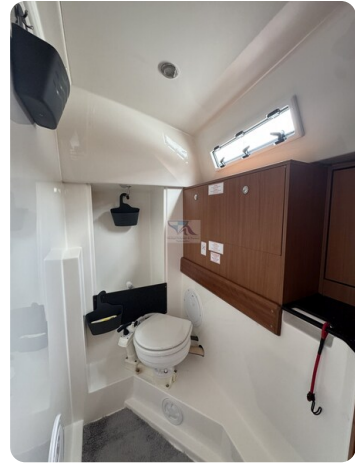
Bavaria 32 Cruiser HERON 44