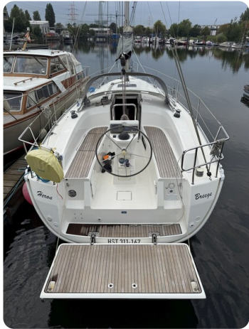
Bavaria 32 Cruiser HERON 11