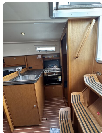
Bavaria 32 Cruiser HERON 40