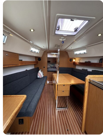
Bavaria 32 Cruiser HERON 41