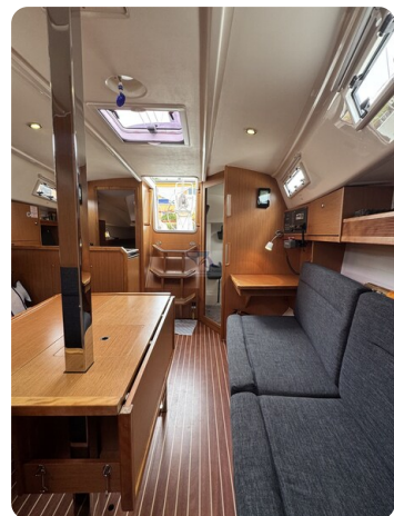
Bavaria 32 Cruiser HERON 34