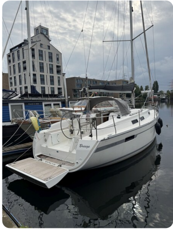
Bavaria 32 Cruiser HERON 4