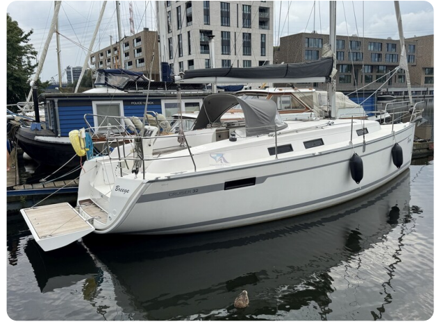
Bavaria 32 Cruiser HERON 7