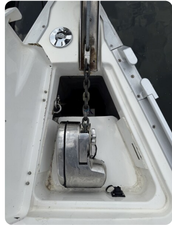
Bavaria 32 Cruiser HERON 68