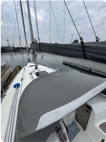
Bavaria 32 Cruiser HERON 61