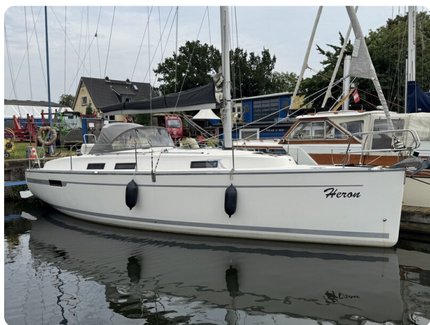
Bavaria 32 Cruiser HERON 6