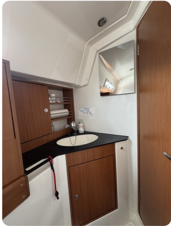
Bavaria 32 Cruiser HERON 43