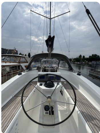
Bavaria 32 Cruiser HERON 58