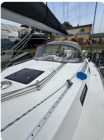
Bavaria 32 Cruiser HERON 63