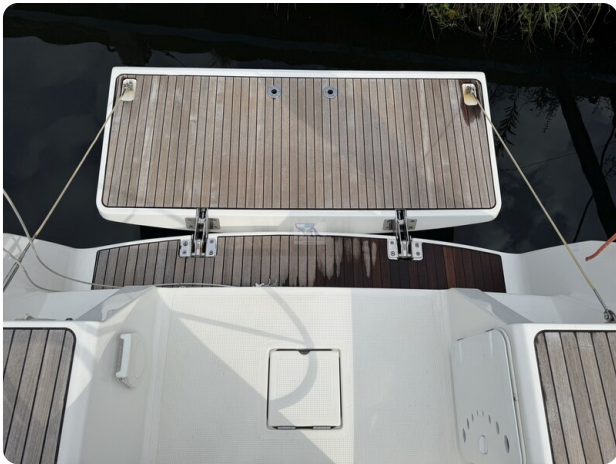
Bavaria 32 Cruiser HERON 59