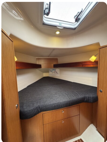
Bavaria 32 Cruiser HERON 30