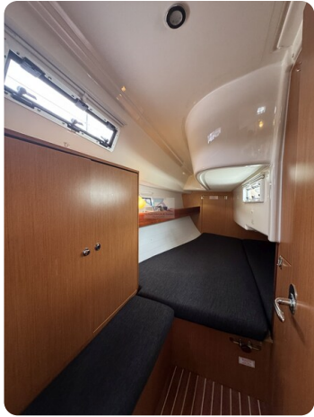
Bavaria 32 Cruiser HERON 24