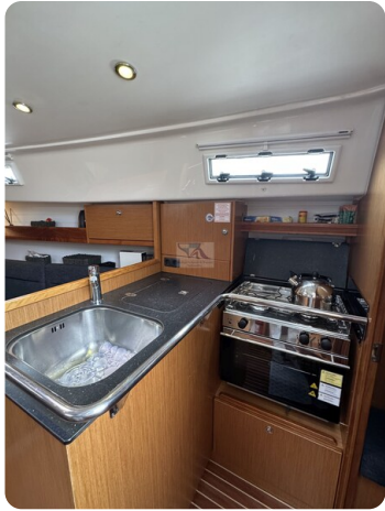
Bavaria 32 Cruiser HERON 38