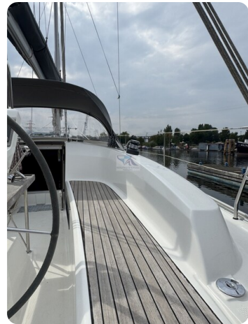
Bavaria 32 Cruiser HERON 57