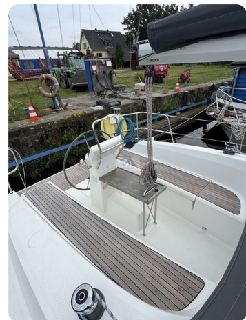
Bavaria 32 Cruiser HERON 45