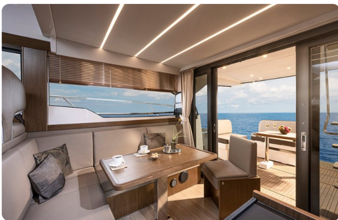
Bavaria 420 coupè dinette