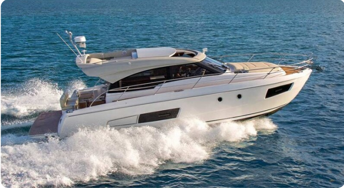
Bavaria 420 coupè Sistership