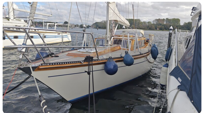
Baltika Decksalon SY 4