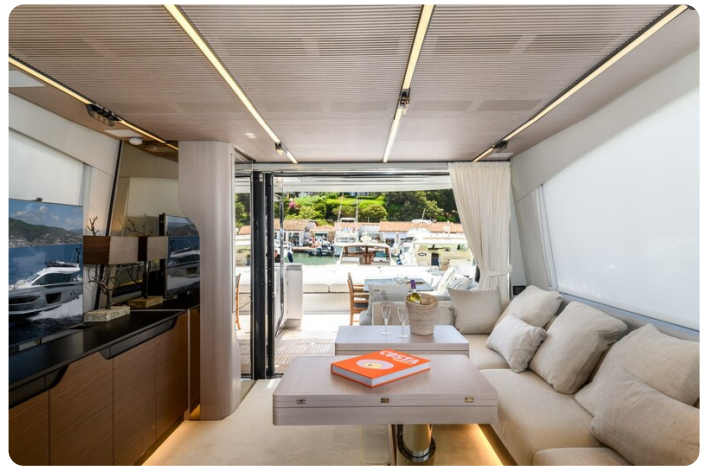
Azimut S7New salon to aft