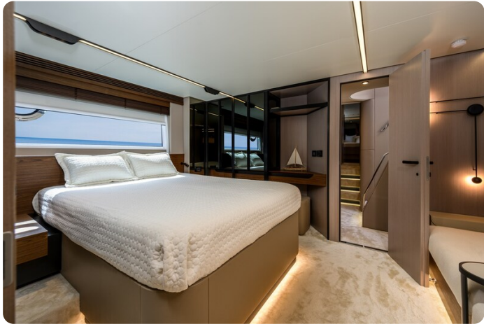
Azimut S7New, owner's cabin