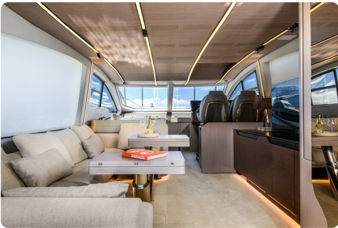
Azimut S7New salon to bow