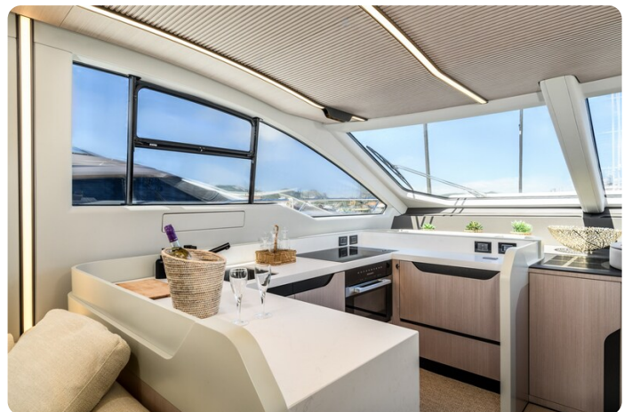
Azimut S7New galley