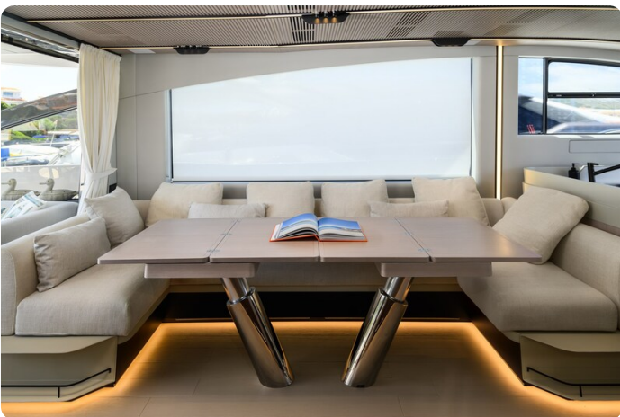
Azimut S7New dinette detail