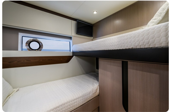
Azimut S7New L guest cabin