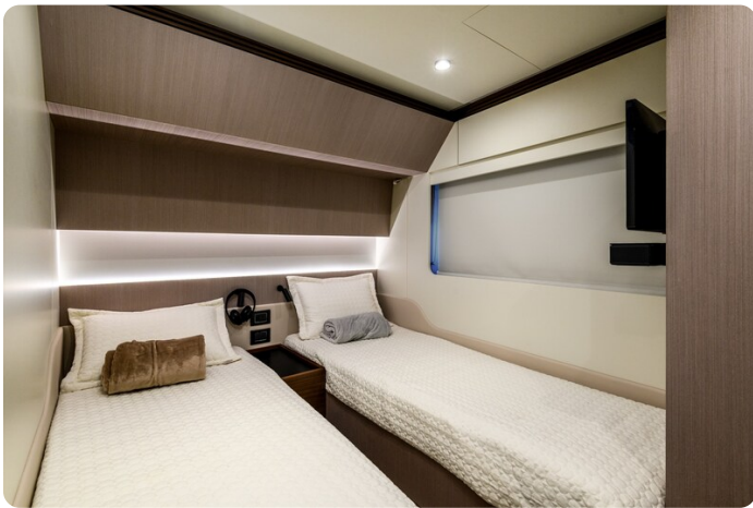
Azimut S7New guest cabin