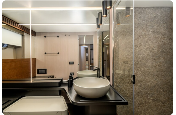
Azimut S7New ownr's bathroom