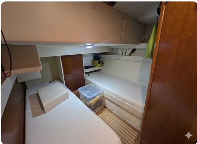
{1} Guest cabin