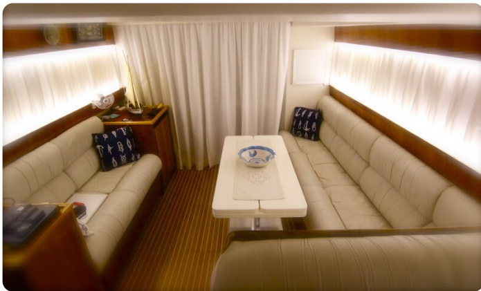
{1} Salon view