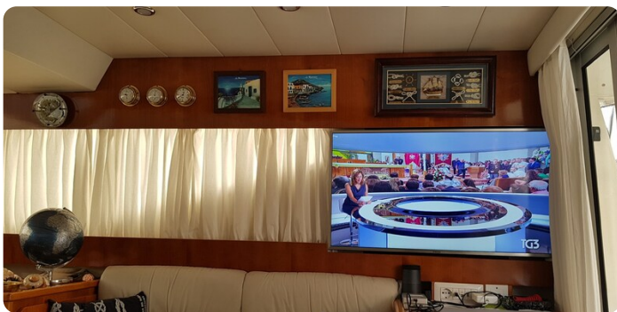
{1} Salon detail