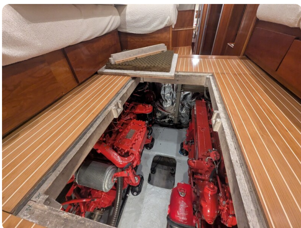
{1} Engine room