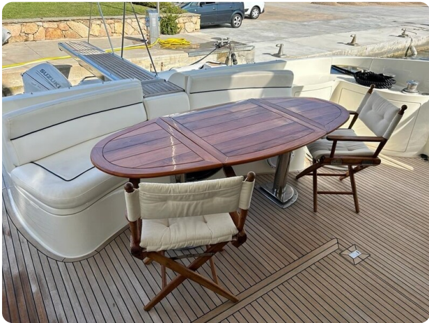
Az 62 Vista pozzetto