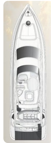
Layout Az 62