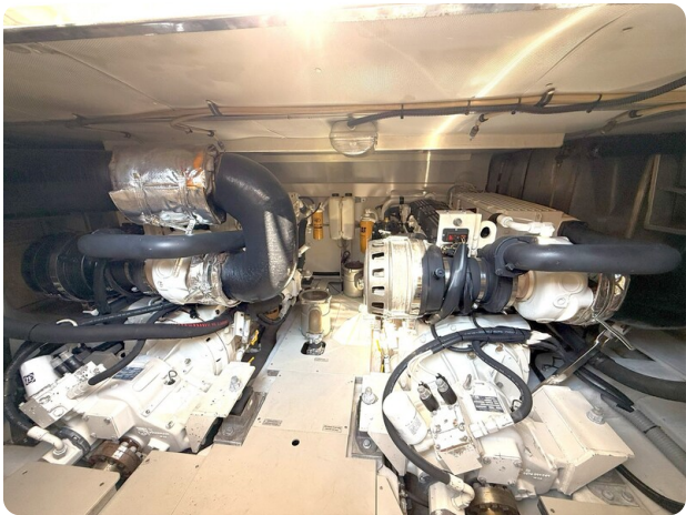
{1} Engine room