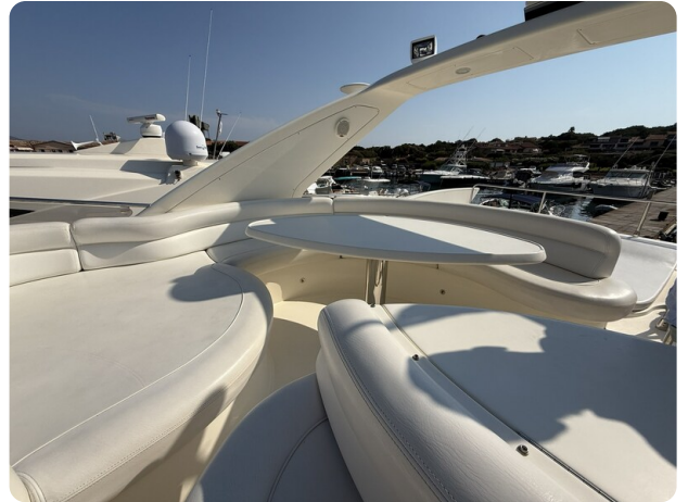
AZIMUT 55 Fly dinette