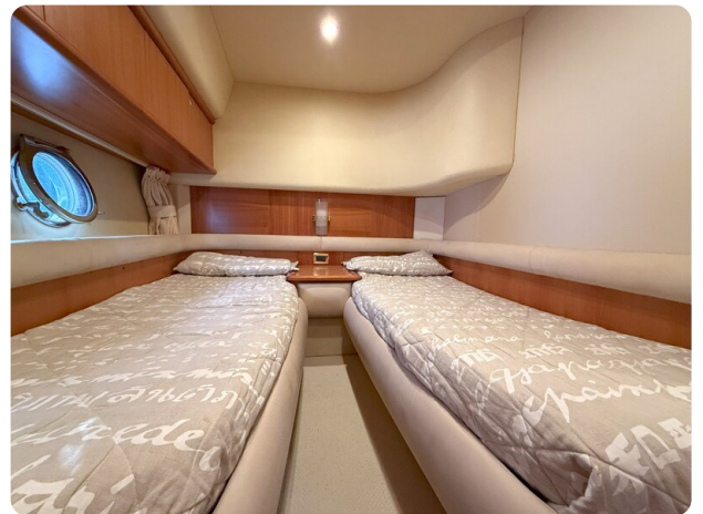
AZIMUT 55 Double cabin