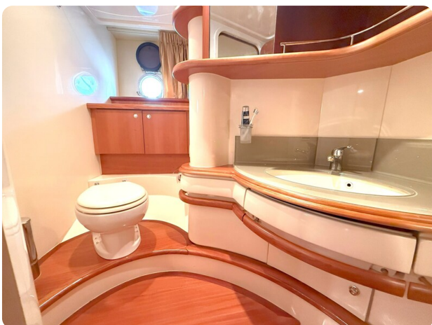
AZIMUT 55 Guest Head