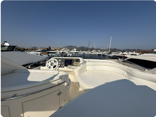
AZIMUT 55 Fly detail