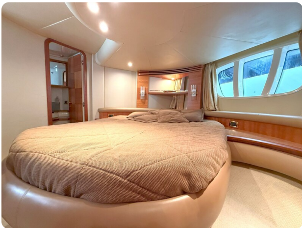
AZIMUT 55 Guest Cabin