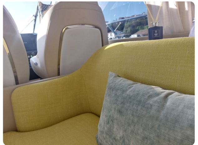
{1} Lounge detail