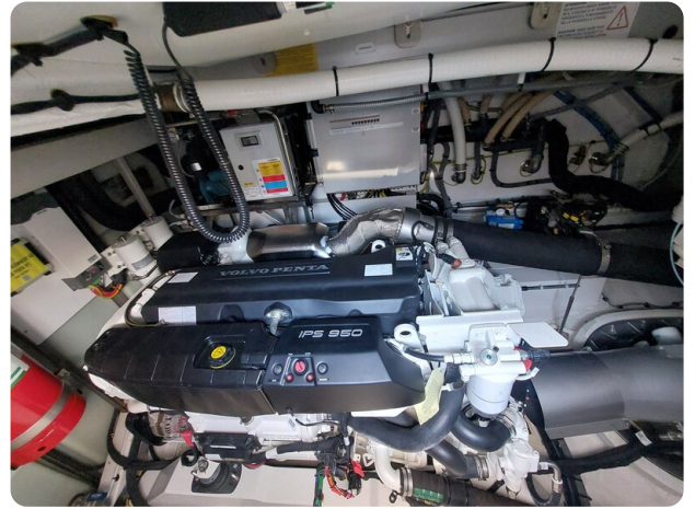
{I} Engine detail