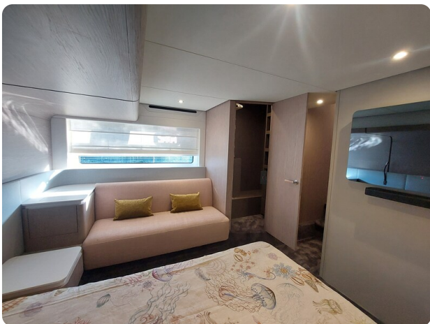
{1} Owner's cabin