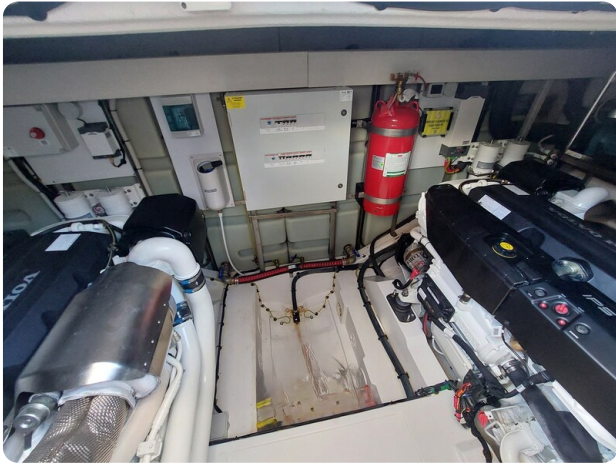
{I} Engine room