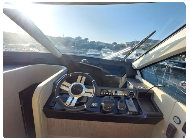
{1} Lower station