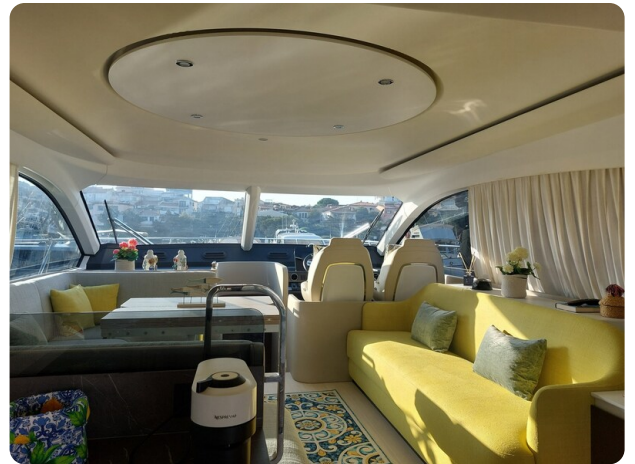
{1} Salon detail