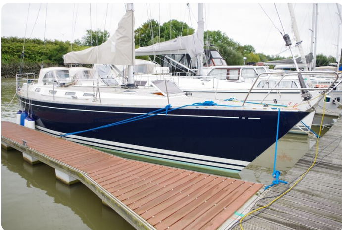
Avance 40 msp636285 2