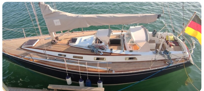
Avance 40 msp636285 1