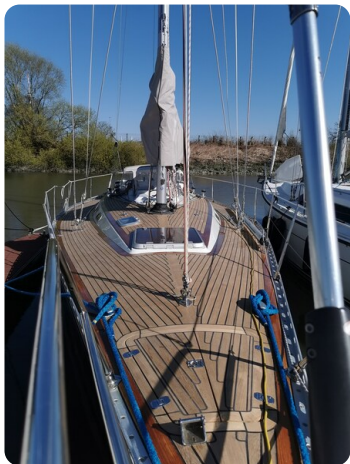
Avance 40 msp636285 5