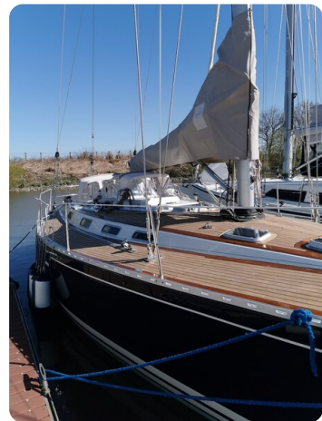
Avance 40 msp636285 6