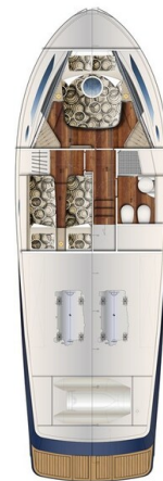
Austin Parker 42, layout