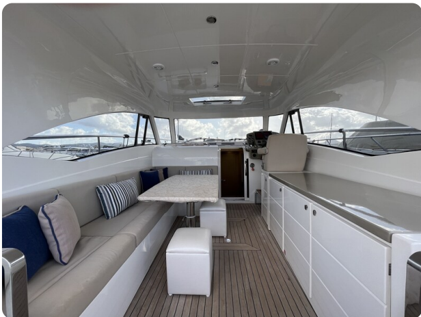
Austin Parker 42, cockpit dinette view