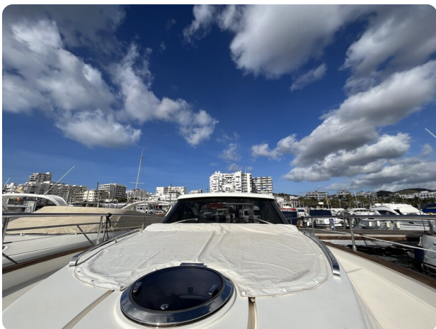
Austin Parker 42, bow sunpad