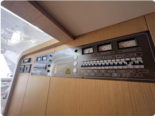
Austin Parker 42 electrical panel