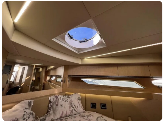
Austin Parker 42 cabin detail