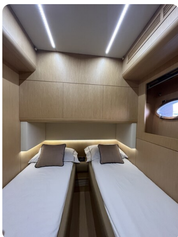
Austin Parker 42, guest cabin