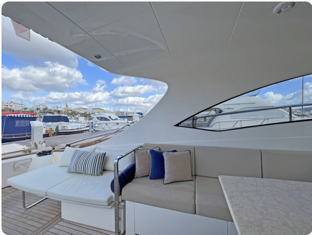
Austin Parker 42, cockpit dinette