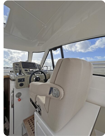
Austin Parker 42, helm station