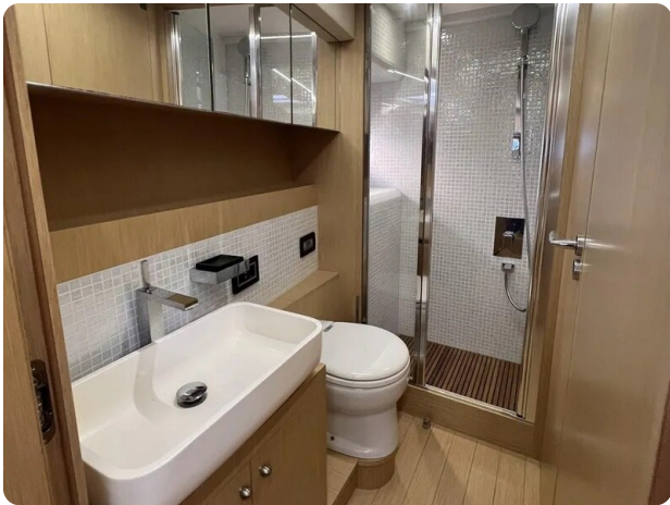
Austin Parker 42 bathroom