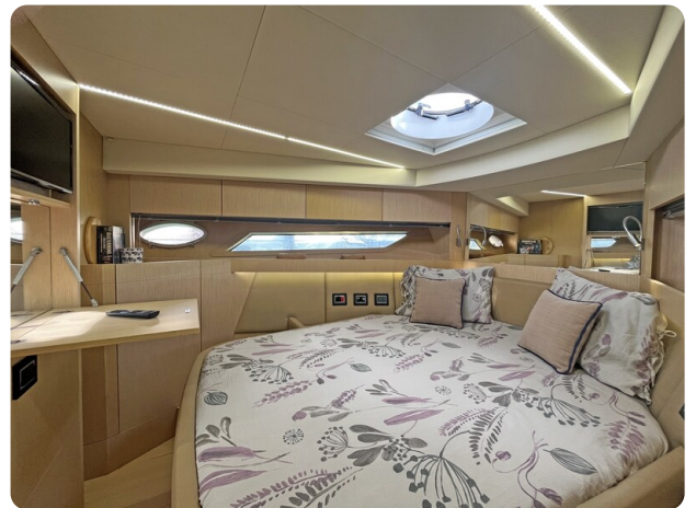
Austin Parker 42, master cabin