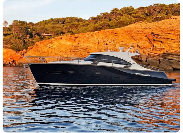
Austin Parker 42, profile