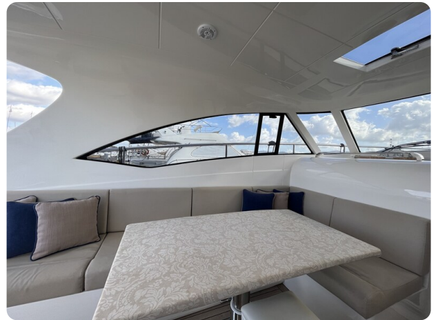
Austin Parker 42, cockpit table