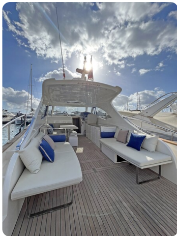
Austin Parker 42, cockpit