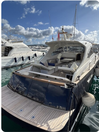
Austin Parker 42, aft view