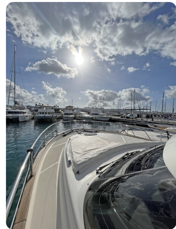
Austin Parker 42, bow deck