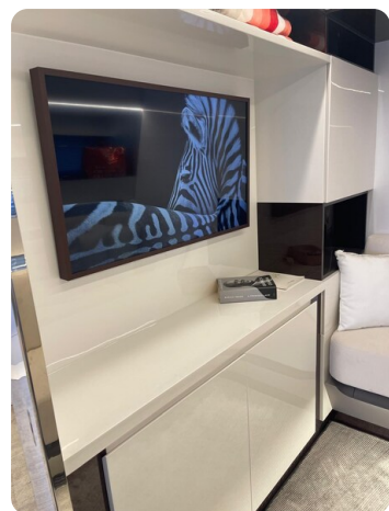
CIAO! room details