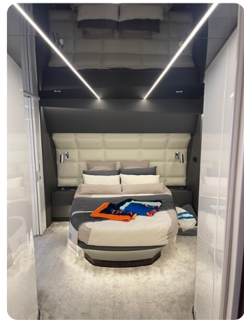
CIAO! cabin details