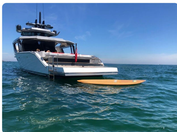
CIAO! profile bwd