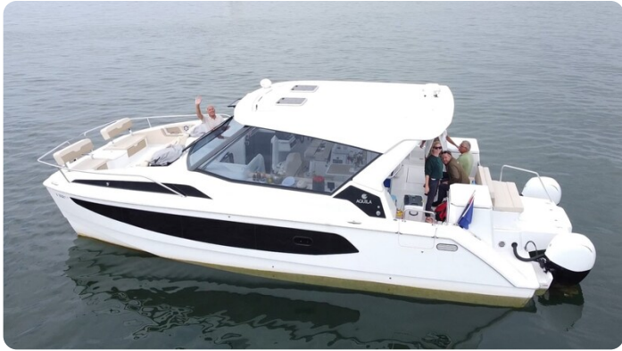
Aquila 36 Sport aerial