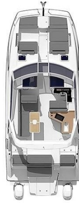
_Aquila 36 Sport Layout