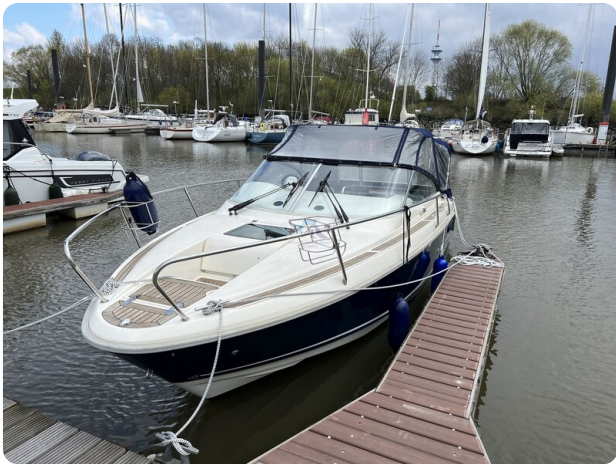
Aquador 23 14