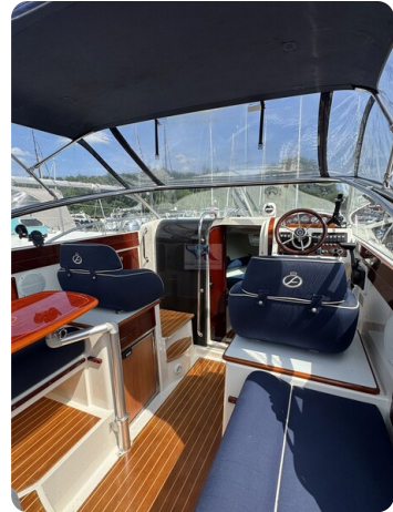
Aquador 23 DC SUND 22