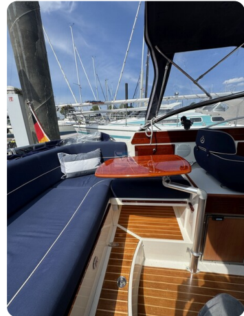
Aquador 23 DC SUND 24