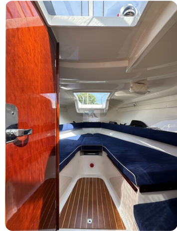
Aquador 23 DC SUND 14