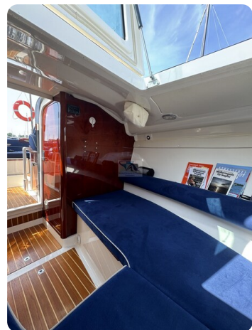
Aquador 23 DC SUND 8