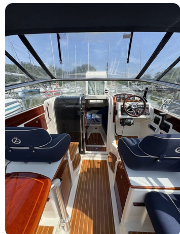
Aquador 23 DC SUND 42