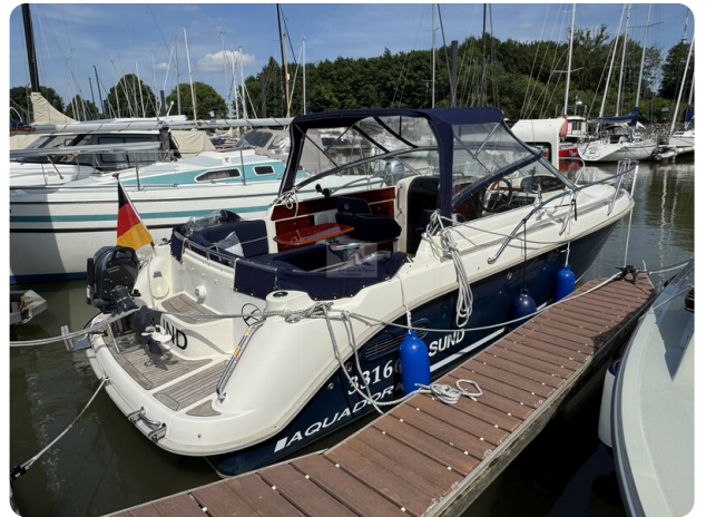
Aquador 23 DC SUND 31