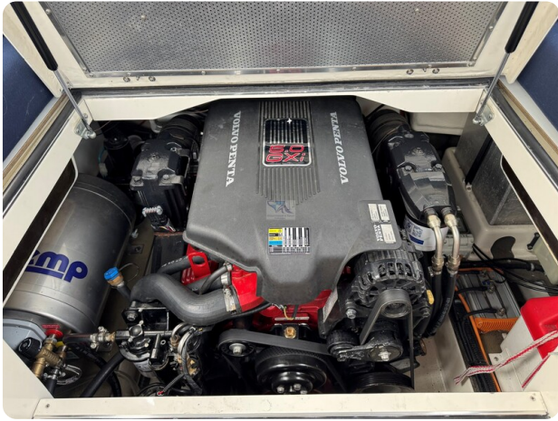
Aquador 23 DC SUND 46