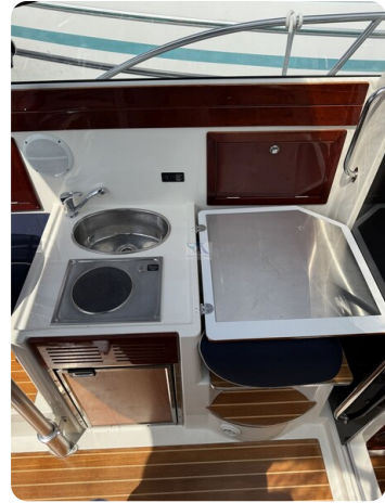
Aquador 23 DC SUND 19