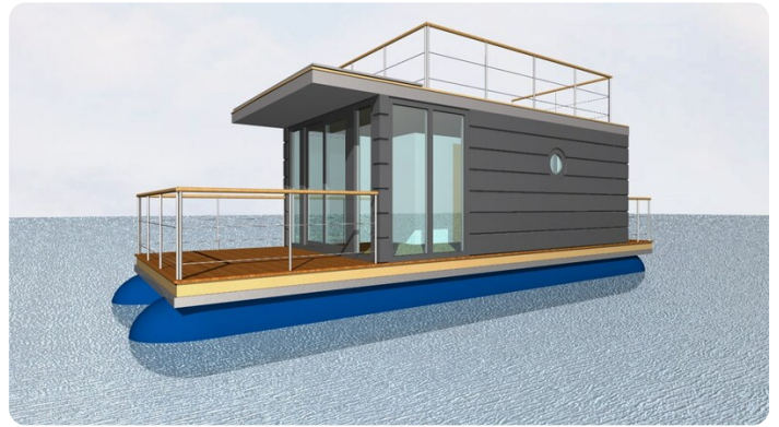
2021.05.17 - kerrafrent VOX trend antracyt - widok 1(2)