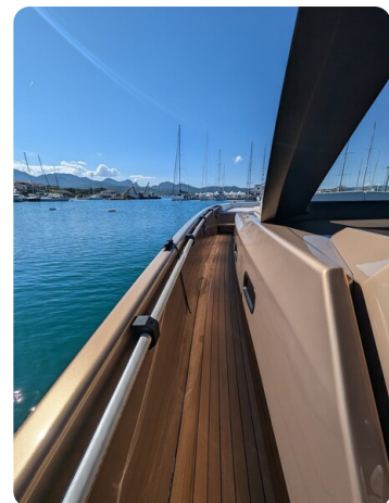
Apex 60 sideways