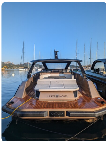
Apex 60 stern view