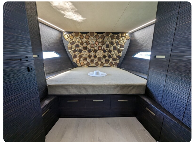
Apex 60 cabin