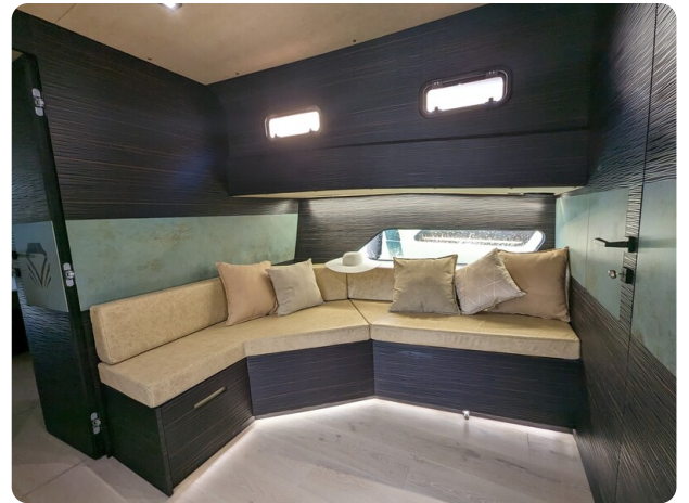
Apex 60 dinette