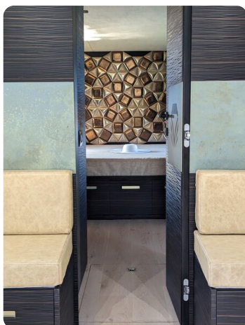
Apex 60 interiors