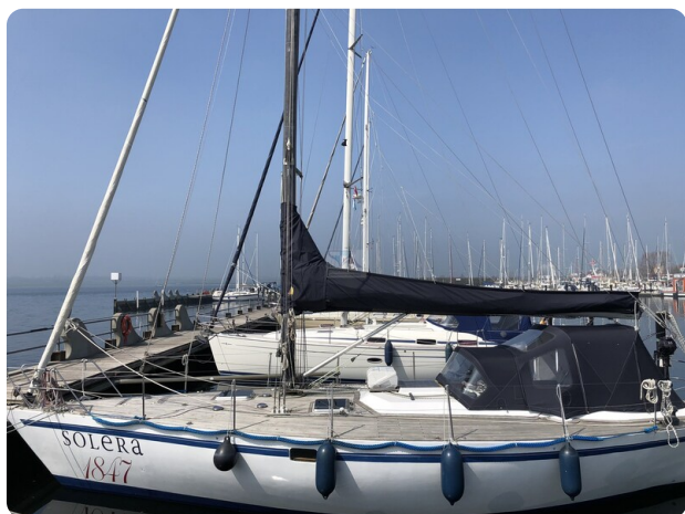
Feltz Alu One Off_113