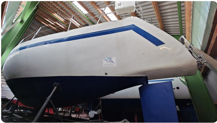
Feltz Alu One Off_8