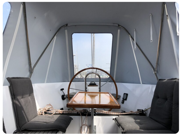
Feltz Alu One Off_89