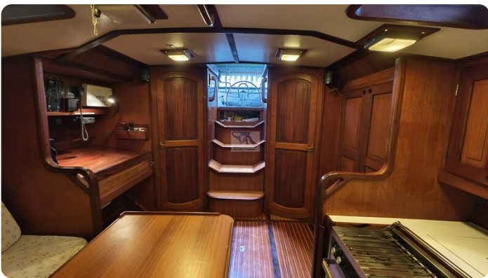
Feltz Alu One Off_49