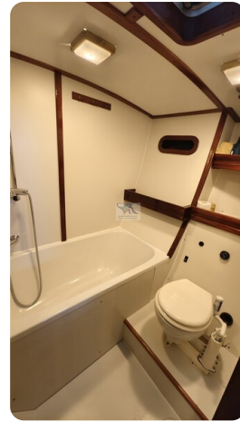
Feltz Alu One Off_58