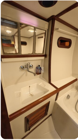
Feltz Alu One Off_60