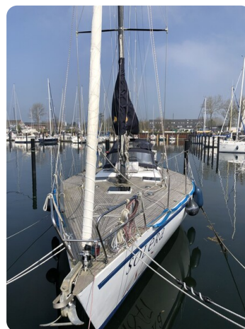
Feltz Alu One Off_111