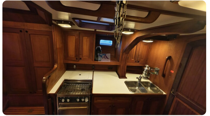
Feltz Alu One Off_53