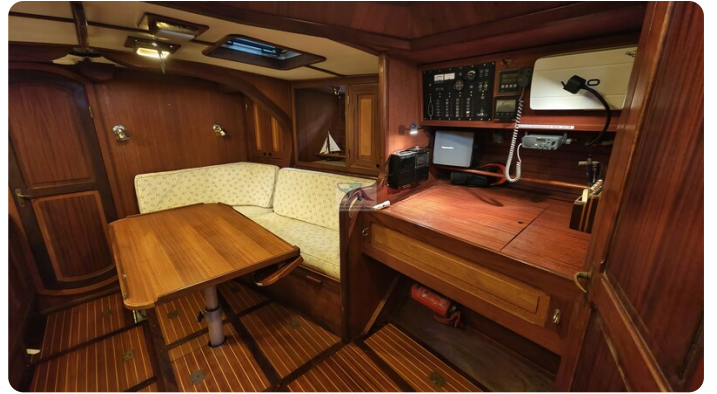
Feltz Alu One Off_42