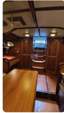
Feltz Alu One Off_48