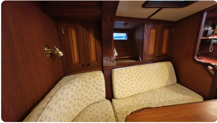
Feltz Alu One Off_52