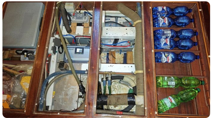
Feltz Alu One Off_68