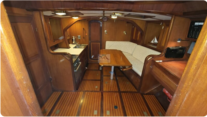
Feltz Alu One Off_39