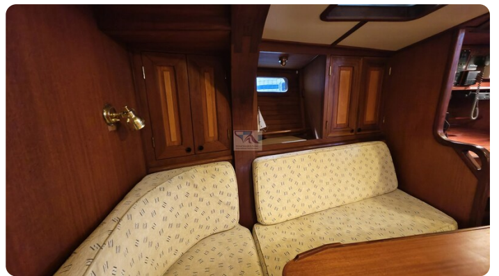
Feltz Alu One Off_52