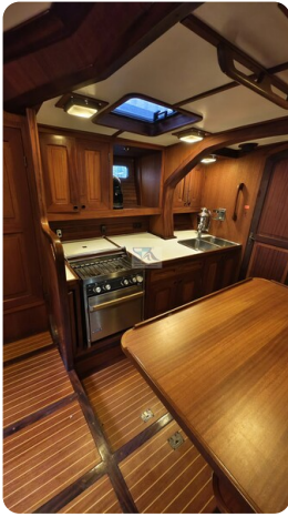
Feltz Alu One Off_44