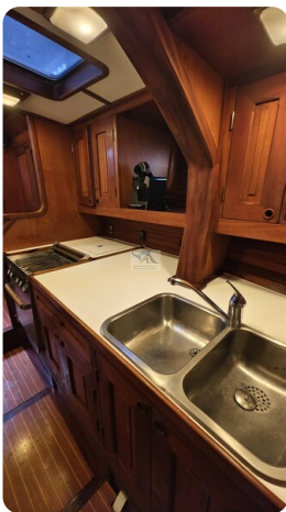
Feltz Alu One Off_66