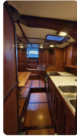
Feltz Alu One Off_61