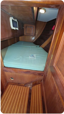
Feltz Alu One Off_76