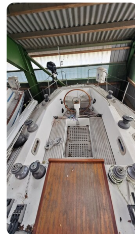
Feltz Alu One Off_27