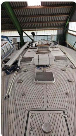
Feltz Alu One Off_15