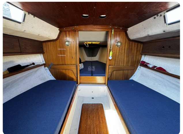
Albin Express 9