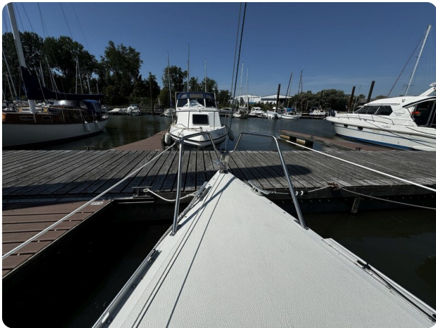
Albin Express 2