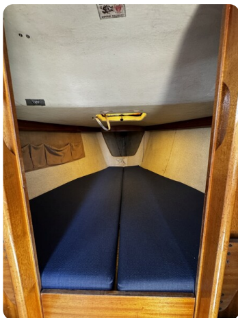
Albin Express 8