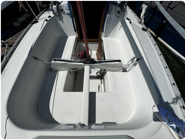
Albin Express 21