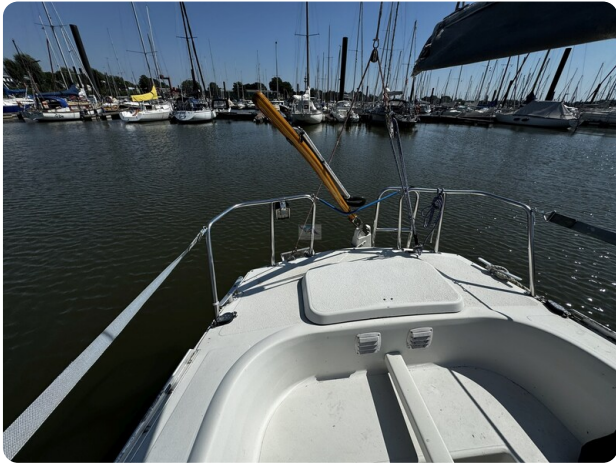
Albin Express 18