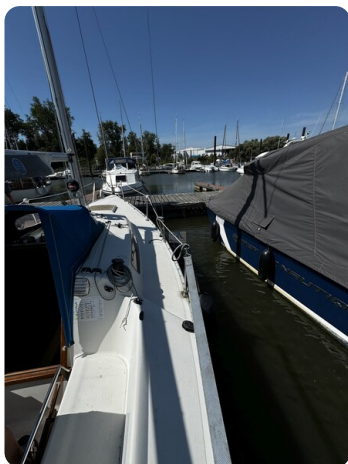
Albin Express 20