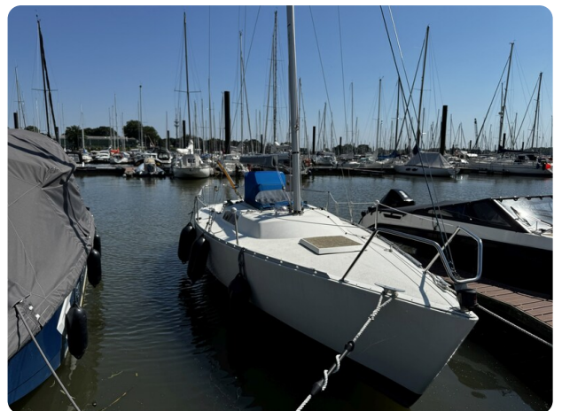
Albin Express 31