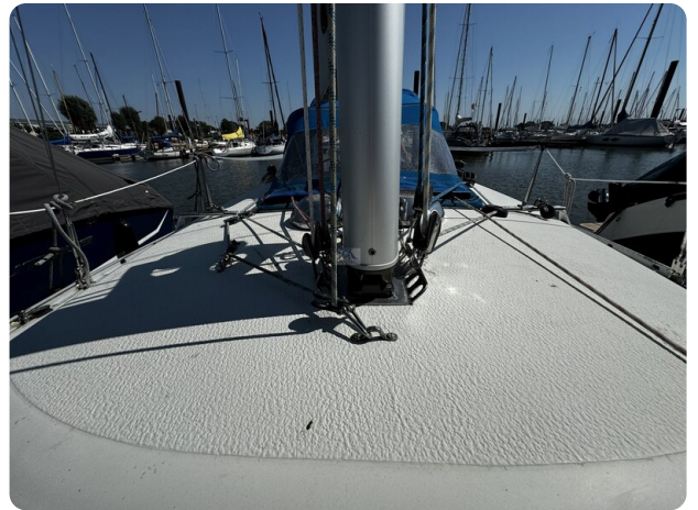
Albin Express 3