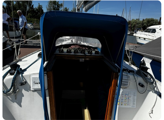
Albin Express 28