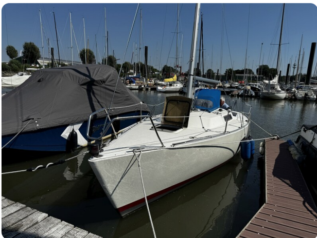
Albin Express 1