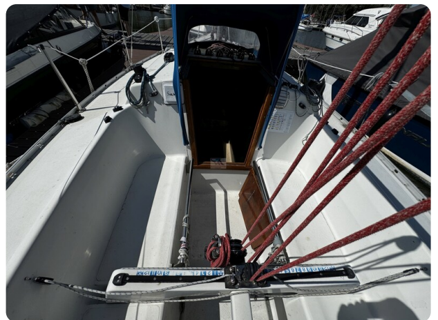
Albin Express 27