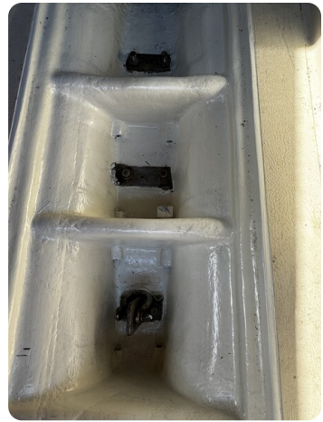
Albin Express 15