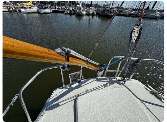
Albin Express 19