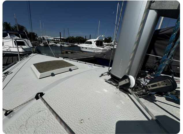
Albin Express 5