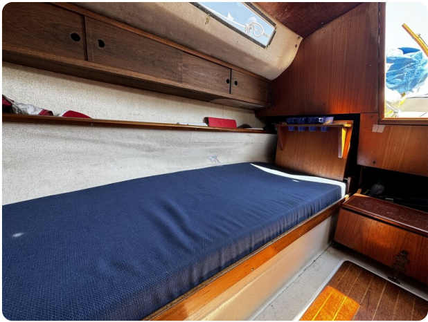
Albin Express 13