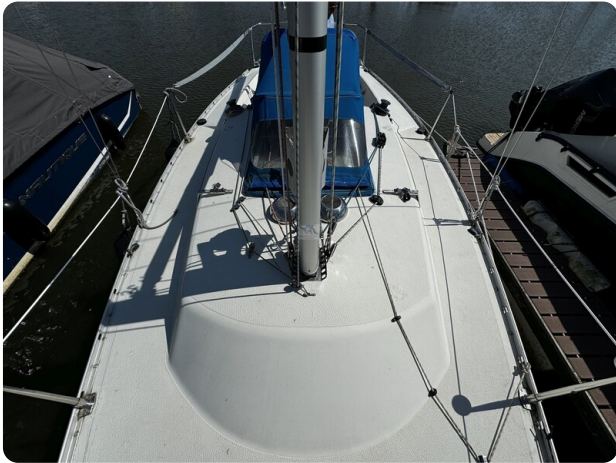
Albin Express 4