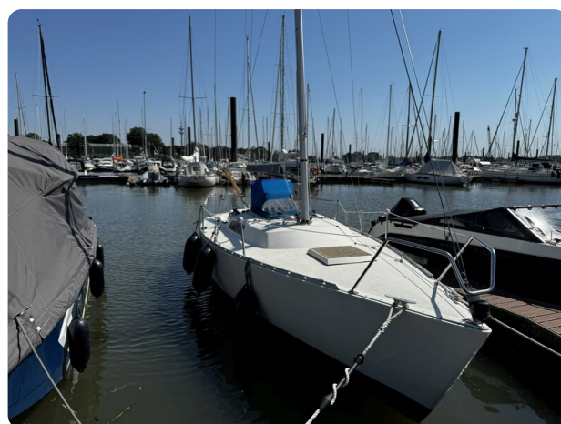
Albin Express 31